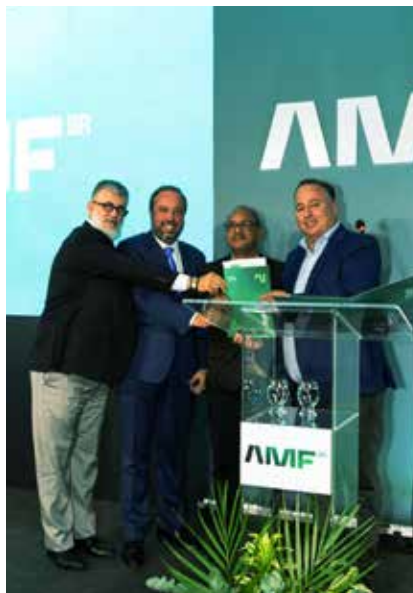
Zeladoria do Planeta assina compromisso de preservação ambiental com AMF - Associação de Mineradoras de Ferro do Brasil