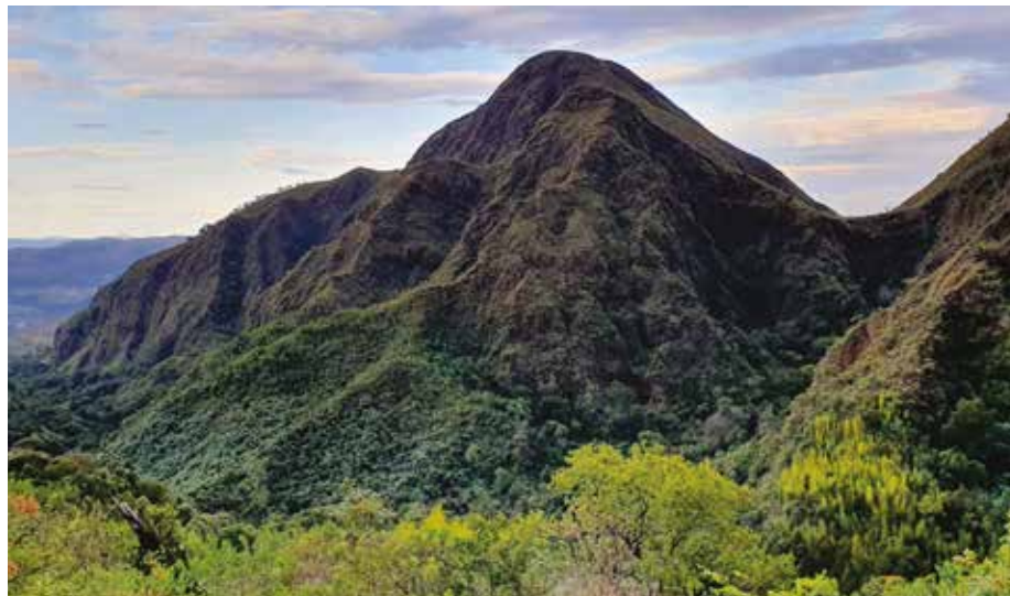
Área que a Tamisa quer minerar

Essas informações são impactantes o suficiente para se exigir que a proposta do Parque seja discutida com profundidade pela população local, diretamente afetada, incluindo aí, residentes urbanos e rurais, comerciantes de toda nature-